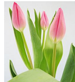
クリスマスドリーム